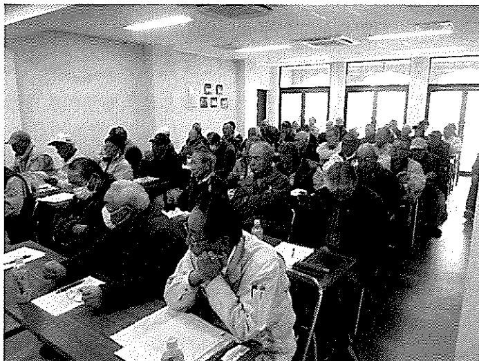
講義に聞き入る会員