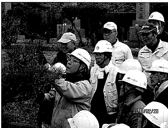
毛利講師による松の剪定指導を熱心に見入る会員